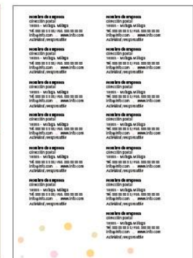
Datos del expositor