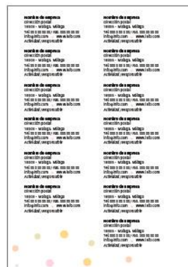
Datos del expositor