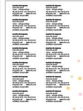
Datos del expositor